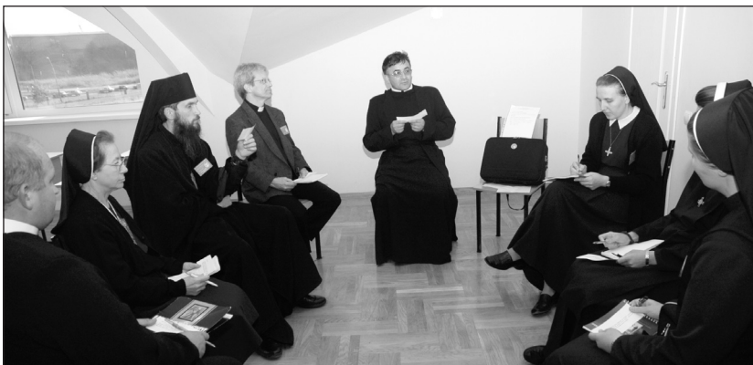
Праця у групі

Певною мірою сучасні монастирі дають усім нам, настоятелям і спільноті, добру можливість для здобуття чеснот смирення і покорі. Адже ж яка нам користь, якщо ми живемо і працюємо серед людей, які нас люблять, або бодай дотримуються правил монастиря і добре поводяться? Коли ж подивимось на сучасні монастирі, то виявимо, що в них живе багато осіб, які мають різноманітні душевні й духовні проблеми, але які водночас прагнуть спасення. У сутності вони так само, як усі люди, наражаються на спокуси диявола. У дорозі до досконалості неминуче потрібно пройти через усі ці терпіння і прикросі. У наш час потрібно виховувати в собі шляхетність духу і навіть делікатний гумор, щоб з Божою поміччю переносити всі терпіння. Лише той може стати сформованим монахом і зможе формувати інших, хто досвідчив на собі злобу лихих духів, що діють через людей, бо сам здобув досвід у духовній боротьбі, бо досвідчив, що його вороги не співбраття чи співсестри, а впалі ангели, які діють через них.